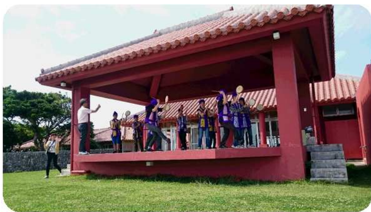
さき たいけん やがい むら咲むら、エイサー体験！！ 野外ステージデビュー！